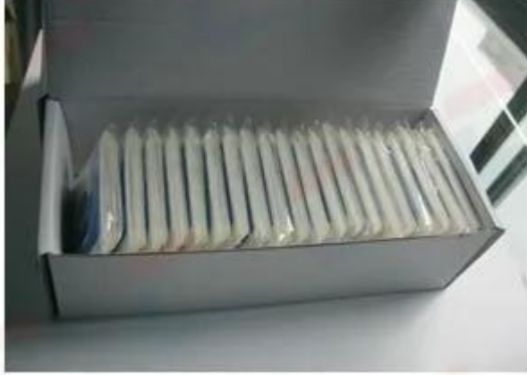
Packed By Pieces with OPP Bags