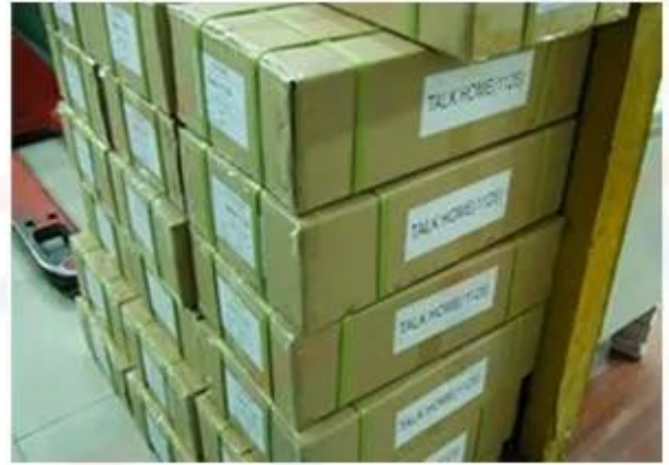
Outside Carton Package