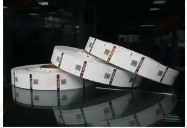
Packed By Roll