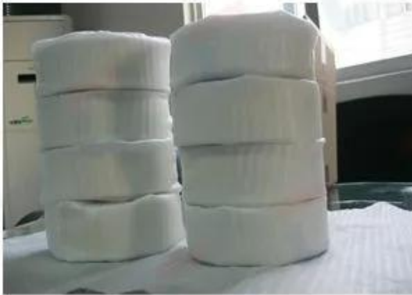
Protect with Bubble Pack