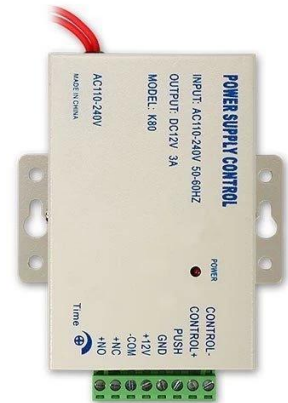
Access Power Supply