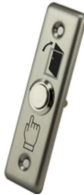
Silver Push Button Switch