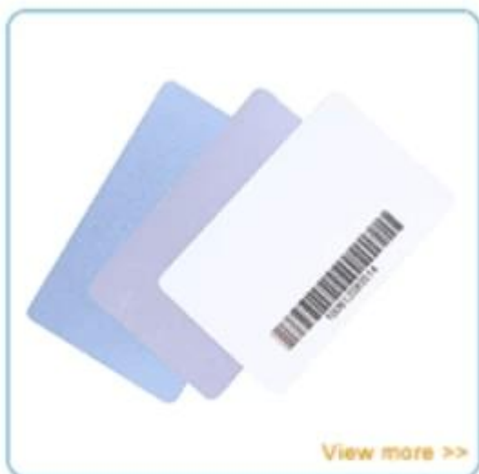
PVC ID card