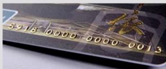
Embossed numbering (Golden)