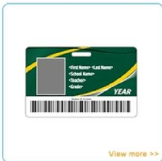
School ID card