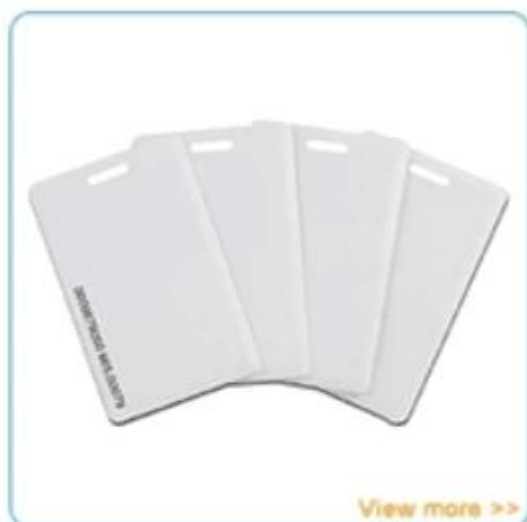
Access control card