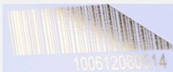
Flat numbering (golden)