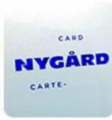
Silk Screen Printing