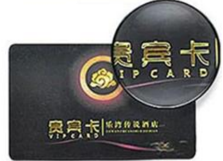
Hot Gold Lettering

We are Producing different RFID Smart Card with different code number