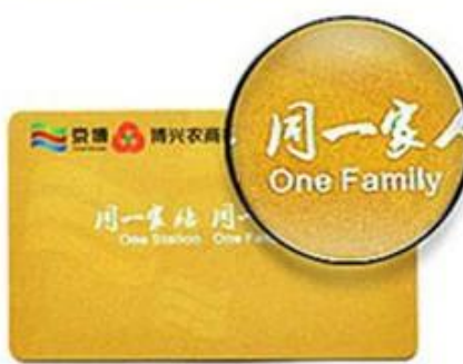
Hot Laser Silver