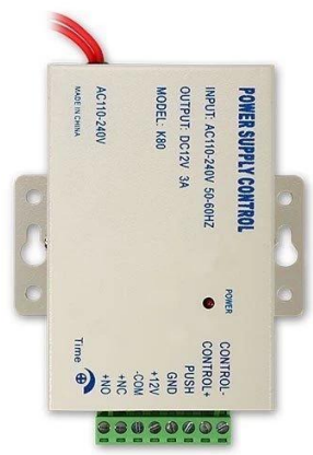
Access Power Supply