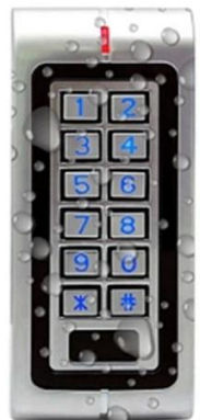
Waterproof RFID Reader Door Access Control