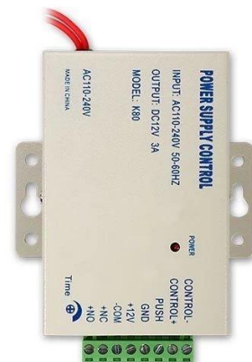
Access Power Supply