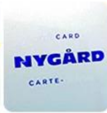
Silk Screen Printing