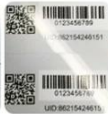
DOD Barcode & QR Code