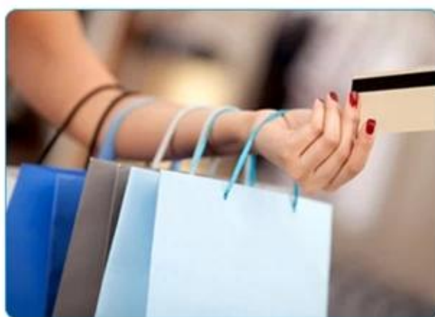
Magnetic Stripe Card