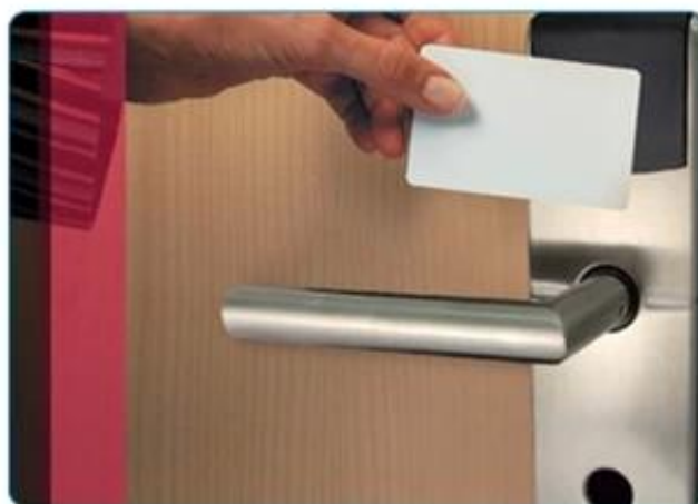
Hotel Card Application