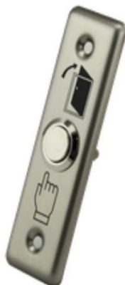
Silver Push Button Switch