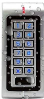
Waterproof RFID Reader Door Access Control