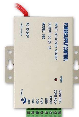
Access Power Supply