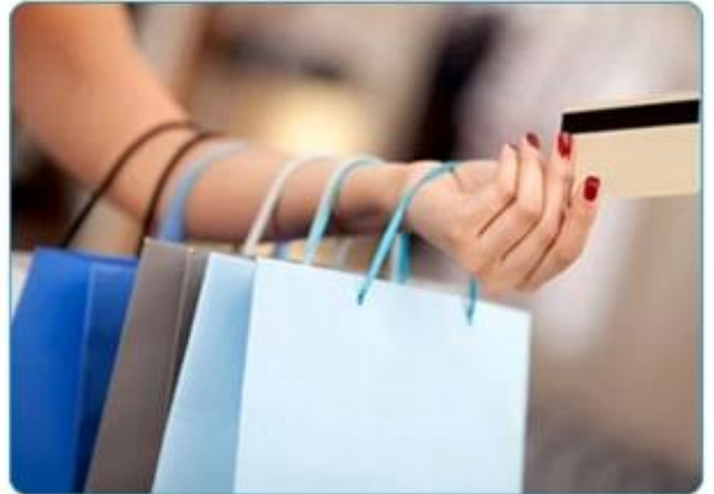
Magnetic Stripe Card