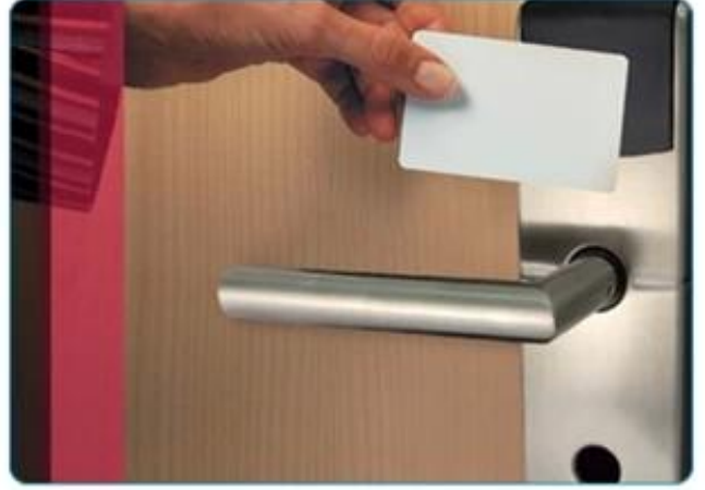
Hotel Card Application