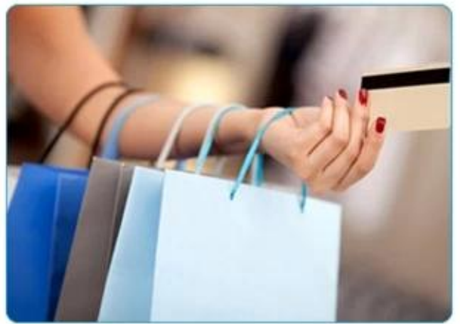
Magnetic Stripe Card