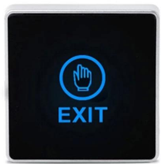
Power on status