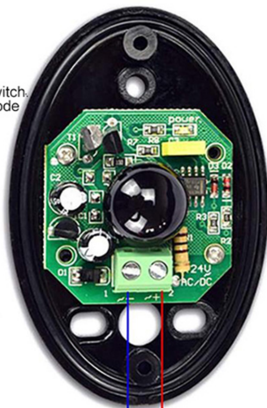
Infrared light projector