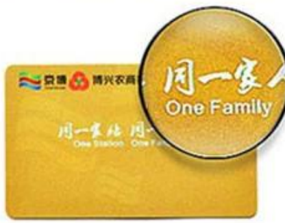
Hot Laser Silver