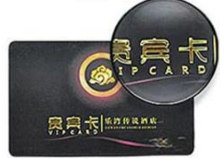
Hot Gold Lettering

We are Producing different RFID Smart Card with different code number