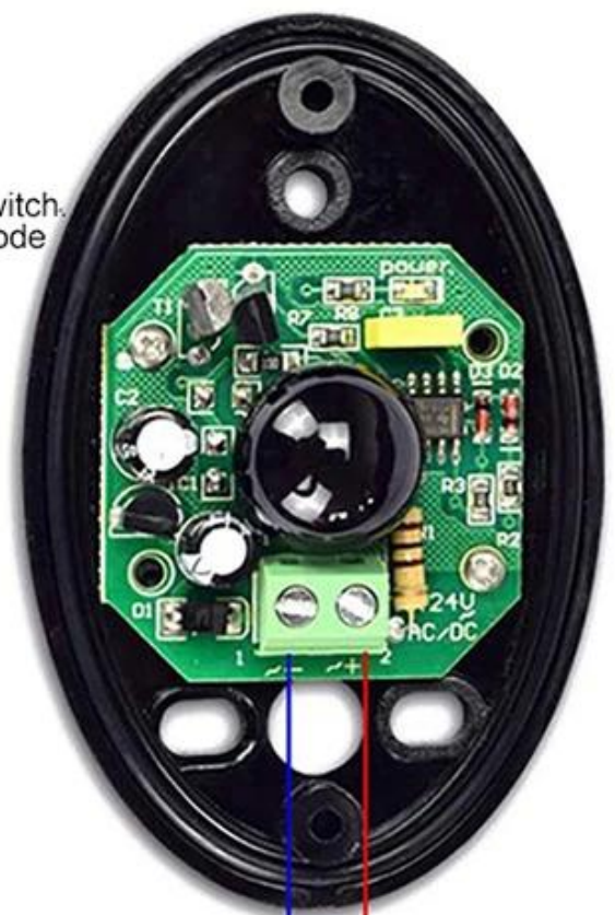
Infrared light projector