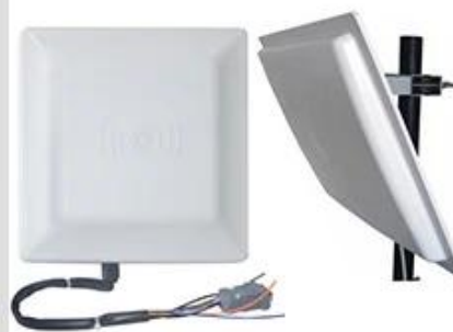
Long Distance UHF Reader