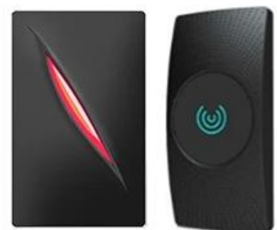
Access Control Reader