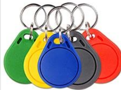
RFID Key fob