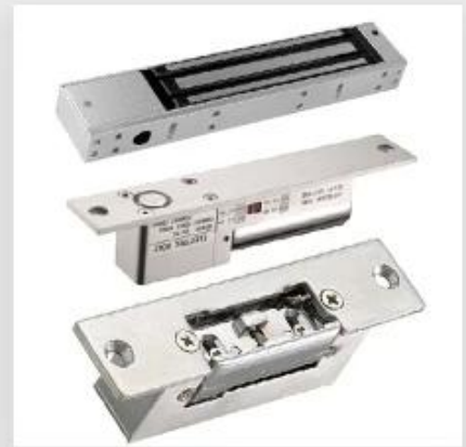
Door EM Lock