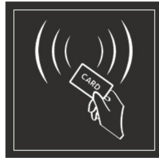
ID EM Cards

Support USB to download attendance record