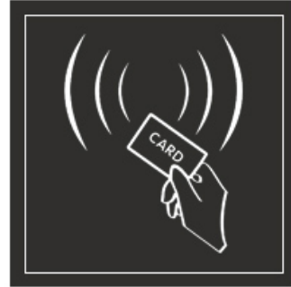
ID EM Cards