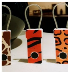
( ACM-Finger710A )

Sample : $ 9.90 100PC : $ 7.85 500PC : $ 7.05