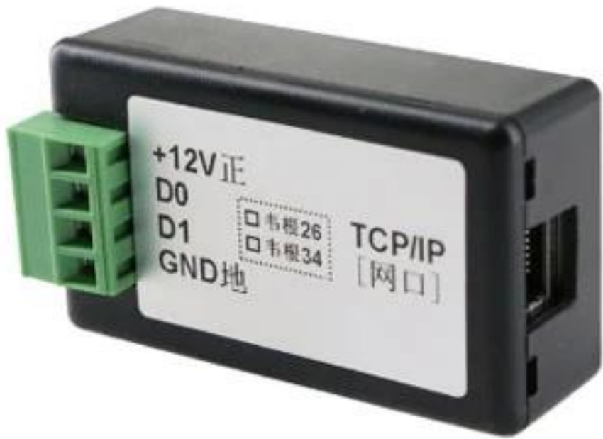
WG to TCP Converter diagram