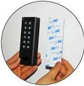
3M sticker for Wireless Keypad