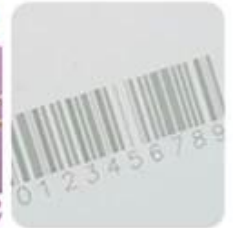
UV Engrave Printing