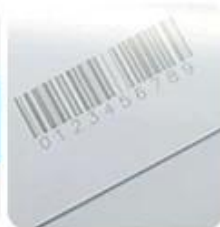
Laser Barcode & QR Code