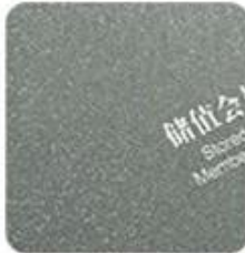
Matt surface (Rough Matt)