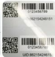
DOD Barcode & QR Code