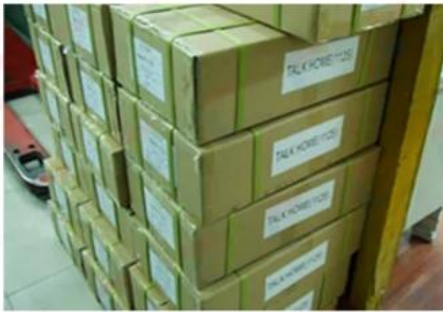
Outside Carton Package