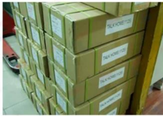
Outside Carton Package