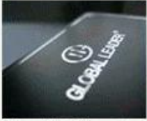
Sliver Hot Stamping