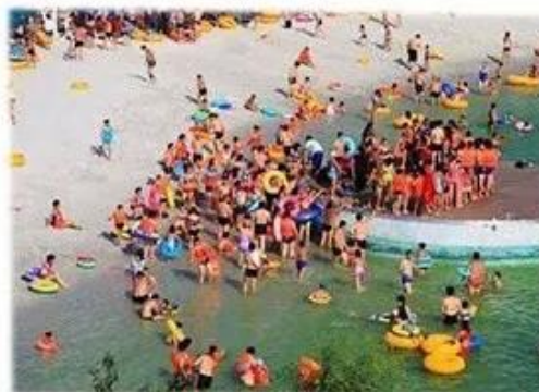
Hot Spring Hotel/Spa