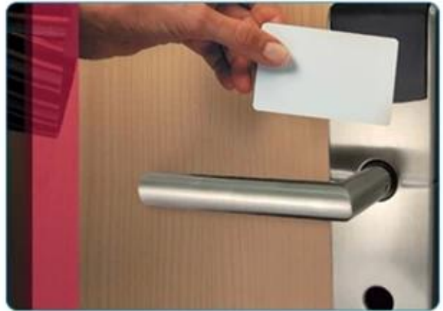
Hotel Card Application