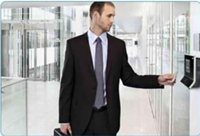
Access Control System