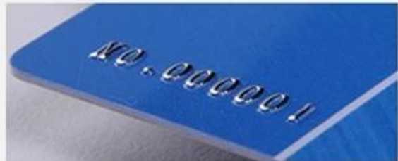
Embossed numbering (Silver)