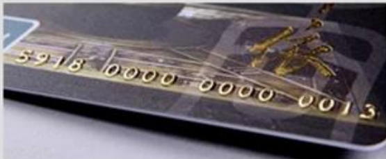
Embossed numbering (Golden)