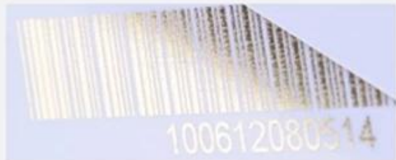
Flat numbering (golden)