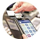
Pay credit card