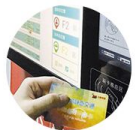
parking access management