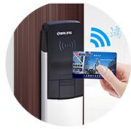
The hotel card