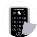
entrance guard card