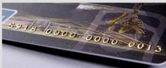
Embossed numbering (Golden)