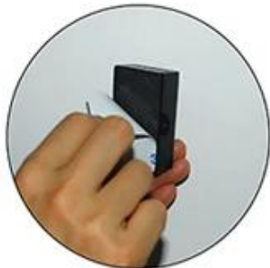
Rip the other side of the sticker