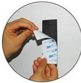
Rip one side of the sticker