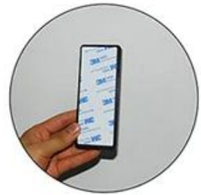
Stick it on the back of the keypad