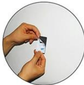
Rip one side of the sticker