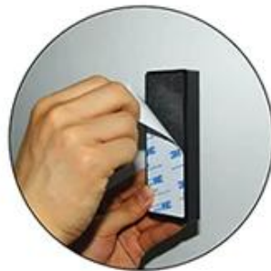
Rip the other side of the sticker