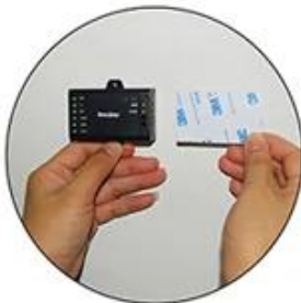
3M Sticker for Mini Controller