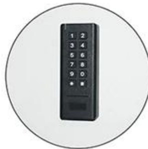
Stick the keypad on the door