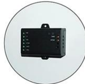
Stick the Mini Controller on the door