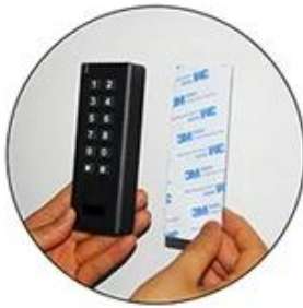
3M sticker for Wireless Keypad