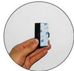
Stick it on the back of the Mini Controller