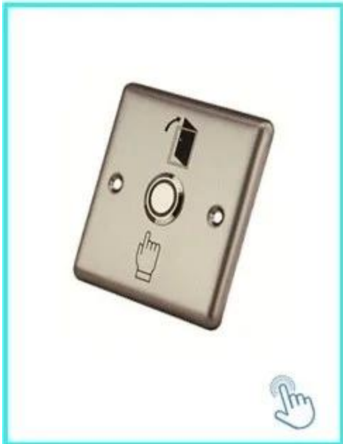
Bouton de sortie Realese de porte