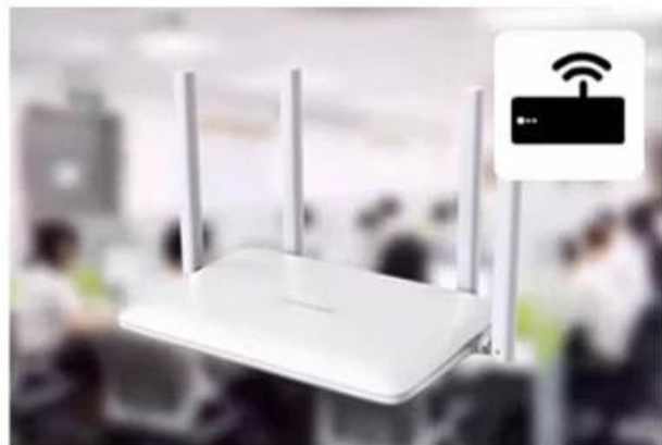
Use router to link with WiFi