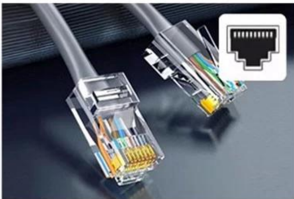
RJ45 network cable