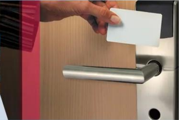
Hotel Card Application