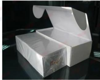
250/200 pcs Cards with Clear Paper