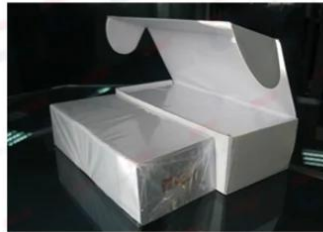
250/200 pcs Cards with Clear Paper