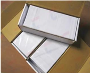
Inner Box Package