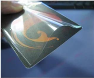
OPP Bag for Individual Card