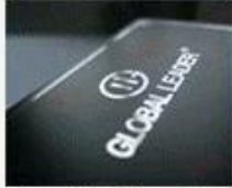
Silver Hot Stamping