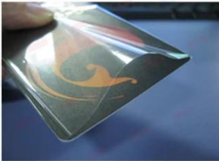
OPP Bag for Individual Card