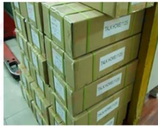
Outside Carton Package