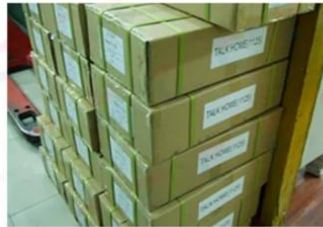
Outside Carton Package