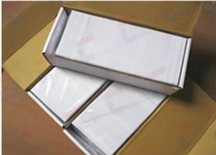
Inner Box Package