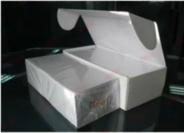
250/200 pcs Cards with Clear Paper