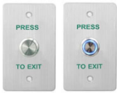
K14F K14FL 115x70mm