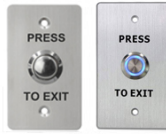
K14 K14DL 115x70mm