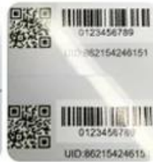
DOD Barcode & QR Code