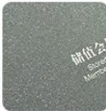
Matt surface (Rough Matt)