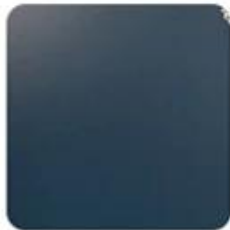
Matt surface (Small Matt)