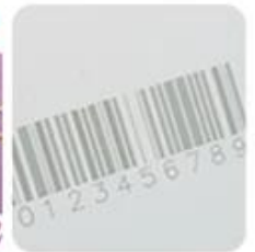
UV Engrave Printing