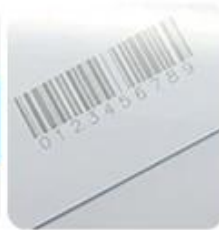
Laser Barcode & QR Code