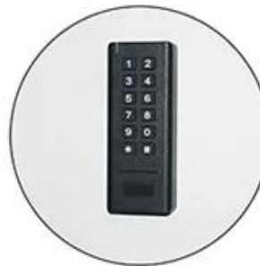
Stick the keypad on the door