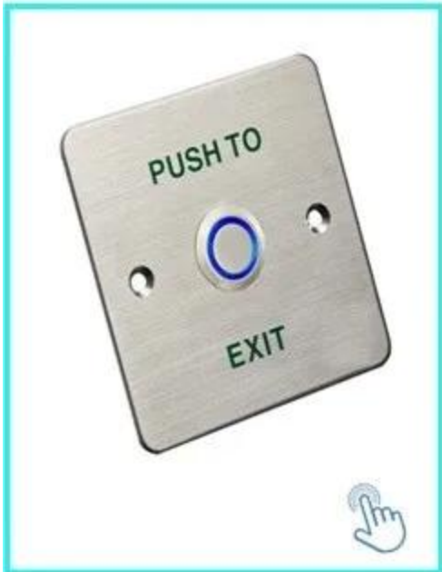
Pulsante di rilascio della porta,