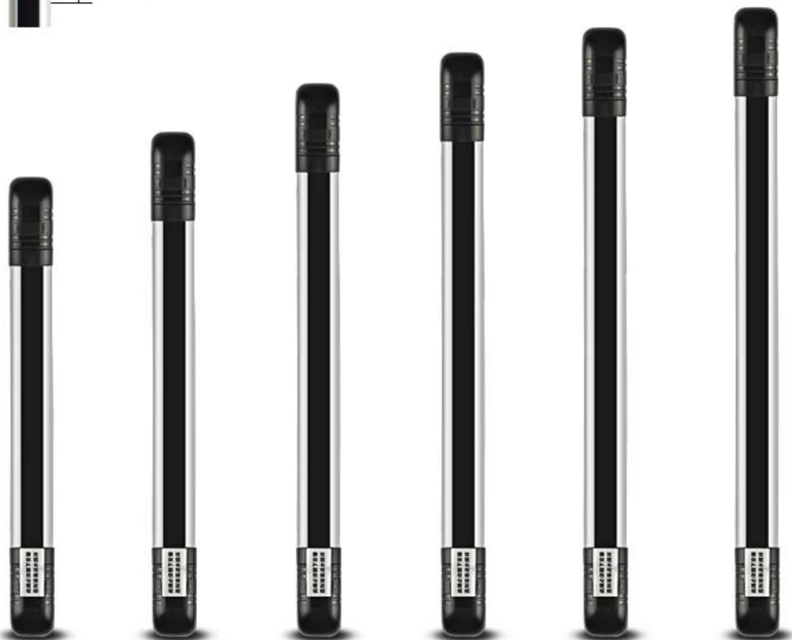
2 Beams Height: 48cm 4 Beams 76cm 6 Beams 108cm 8 Beams 140cm 10 Beams 172cm 12 Beams 204cm