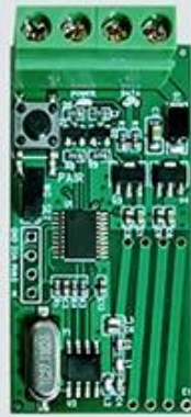
Standard terminal connect with all of controller by wires