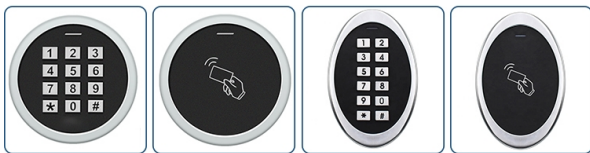
ACM-S99 ACM-M2 ACM-S5 ACM-S6