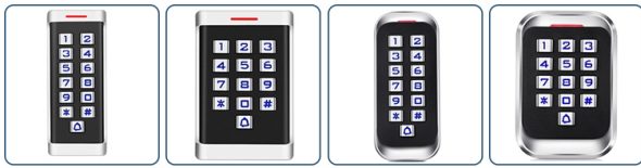
ACM-H1 ACM-H2 ACM-H3 ACM-H4