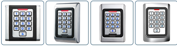
ACM-K6 ACM-K8 ACM-K9 ACM-K10