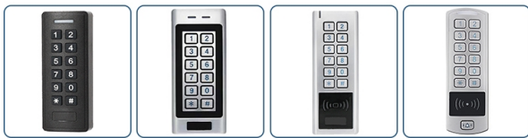
ACM-SK2 ACM-SK4 ACM-SK5 ACM-SK6-X