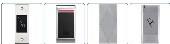
ACM-S99 ACM-M2 ACM-S5 ACM-S6