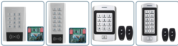
ACM-K7 ACM-S7 ACM-K8 ACM-S8