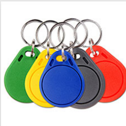
RFID Key fob