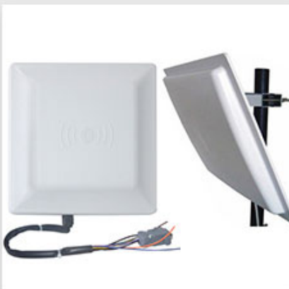
Long Distance UHF Reader