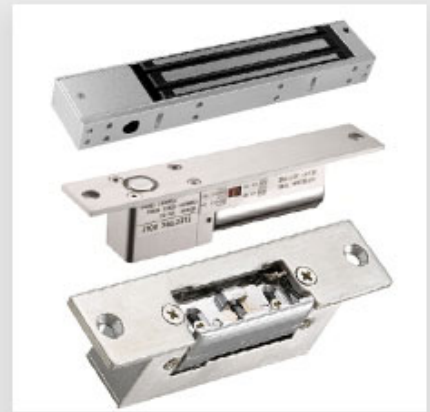
Door EM Lock