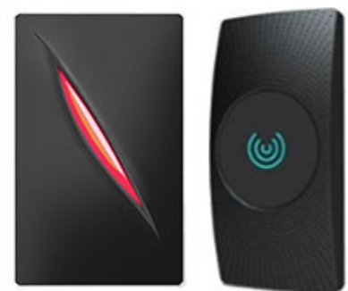
Access Control Reader