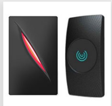
Access Control Reader