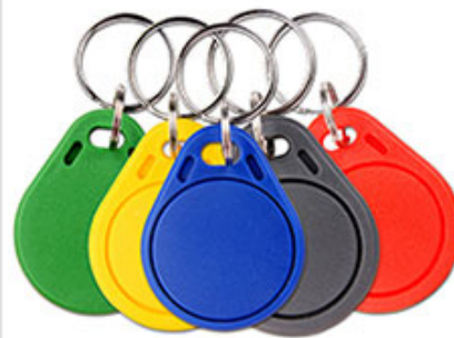
RFID Key fob