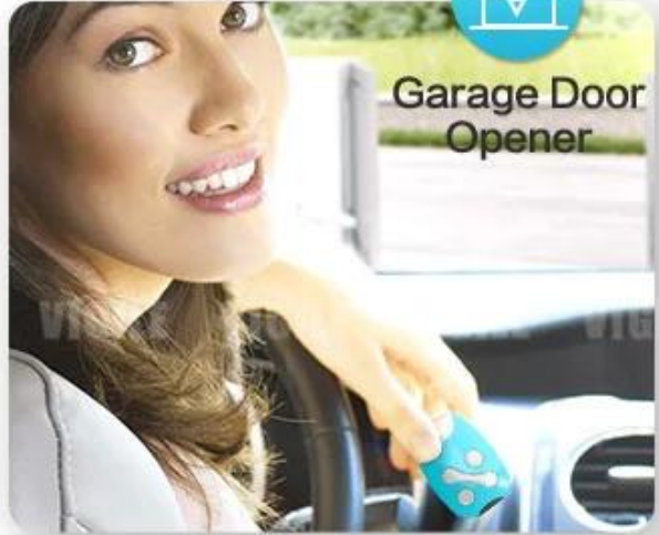
Garage Door Opener