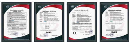
Access Control CE Access Control RoHS EM Lock EMC Certificate EM Lock ROHS Certificate