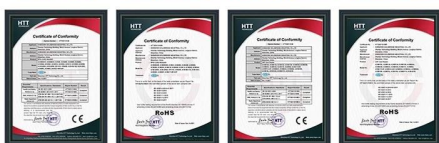
RFID Card Reader CE RFID Card Reader RoHS UHF Reader CE Certificate UHF Reader ROHS