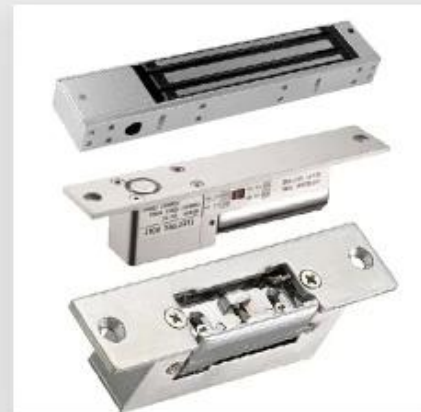
Door EM Lock