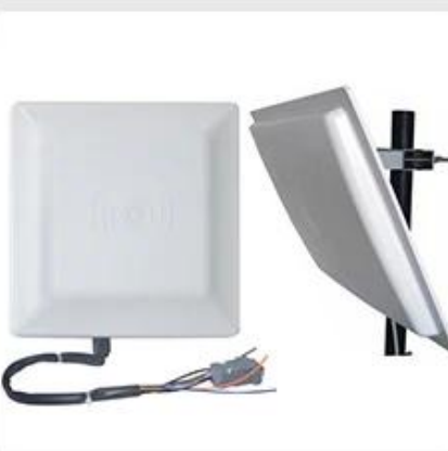
Long Distance UHF Reader