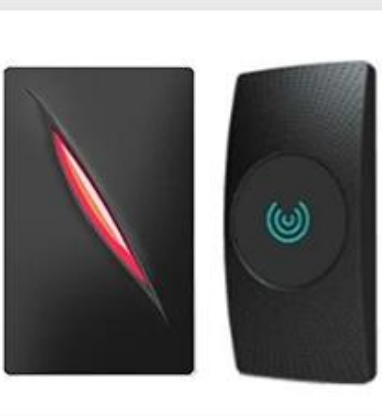
Access Control Reader