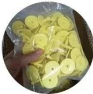
100pcs per bag