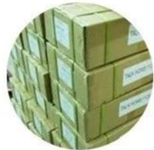
Outer carton package