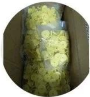
1000pcs per carton