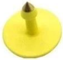
Rfid ear tag