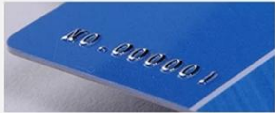
Embossed numbering (Silver)