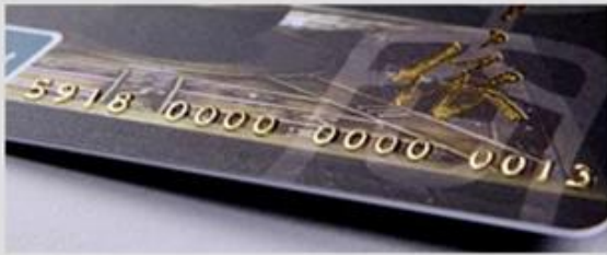
Embossed numbering (Golden)