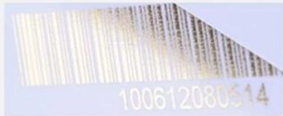
Flat numbering (golden)