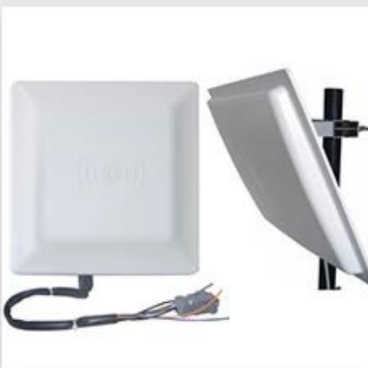
Long Distance UHF Reader