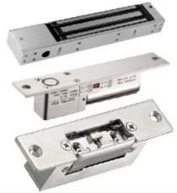
Door EM Lock