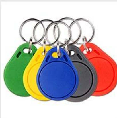
RFID Key fob