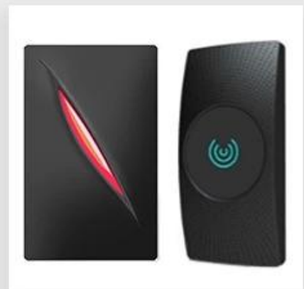
Access Control Reader