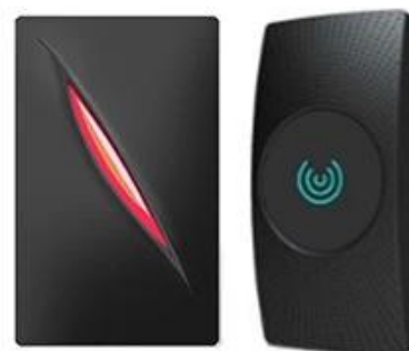
Access Control Reader