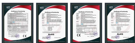
Access Control CE Access Control RoHS EM Lock EMC Certificate EM Lock RoHS Certificate