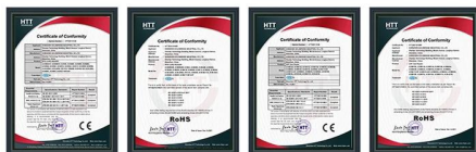
RFID Card Reader CE RFID Card Reader RoHS UHF Reader CE Certificate UHF Reader RoHS