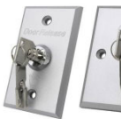
K4AC K4AD 86x86x38mm